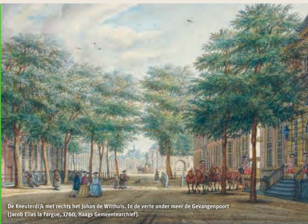
De Kneuterdijk met rechts het Johan de Witthuis. In de verte onder meer de Gevangenpoort (Jacob Elias la Fargue, 1760, Haags Gemeentearchief).