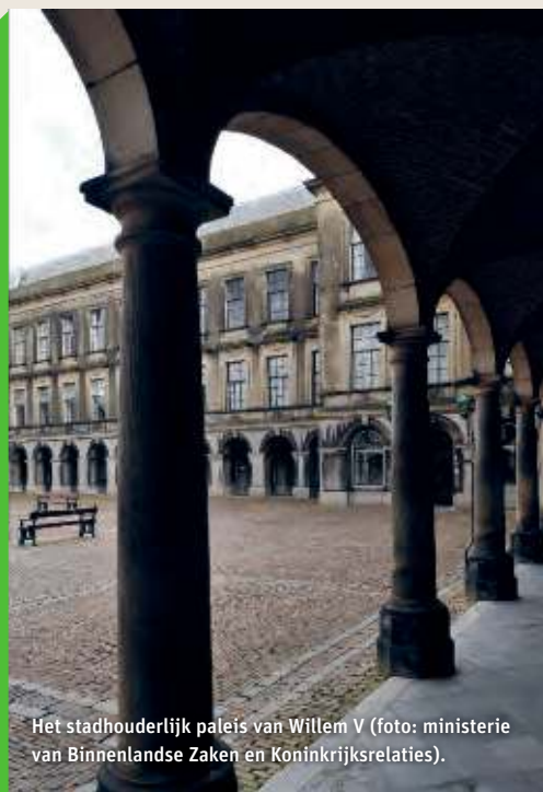
Het stadhouderlijk paleis van Willem V.

Na het einde van het Tweede Stadhouderloze Tijdperk werd Willem IV de eerste erfstadhouder van alle Nederlandse gewesten. In 1751 werd hij opgevolgd door zijn zoon Willem V, die in 1776 de opdracht gaf tot de bouw van een nieuw stadhouderlijk paleis aan de zuidzijde van het Binnenhof. In 1790 kon hij het in gebruik nemen. Het meest imposante vertrek van het paleis was de balzaal op de eerste verdieping. Lang heeft hij er niet van kunnen genieten. In 1795 brak de Bataafse Revolutie uit. Stadhouder Willem V en zijn familie vluchtten naar Engeland en er kwam een einde aan de Republiek der Zeven Verenigde Nederlanden. Het paleis werd na 1795 gebruikt als vergaderruimte voor het parlement van de Bataafse Republiek. Van 1815 tot 1992 was de balzaal de vaste behuizing van onze Tweede Kamer.