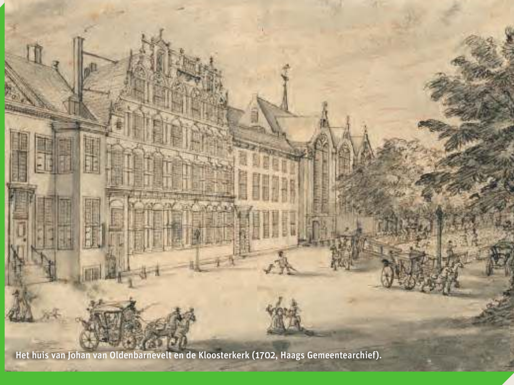
Het huis van Johan van Oldenbarnevelt en de Kloosterkerk (1702, Haags Gemeentearchief).

Tussen de Algemene Rekenkamer en de Kloosterkerk staat het Pagehuis. Het huis stamt uit het begin van de zeventiende eeuw en is voorzien van een karakteristieke trapgevel. Het perceel maakte oorspronkelijk deel uit van het Dominicanenklooster, waar de Kloosterkerk ook toe behoorde. Het huis was eigendom van de Staten van Holland. Tot 1665 werd het bewoond door de kanonnengieter. Daarna werd het pand in gebruik genomen als behuizing voor pages. Pages waren jongemannen uit vooraanstaande families die in dienst traden van de Oranjes. De pages volgden een opleiding aan de Delftse academie en verhuisden daarna naar Den Haag om te werken aan het stadhouderlijke hof.