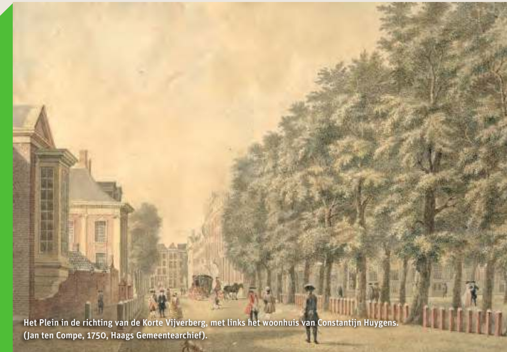
Het Plein in de richting van de Korte Vijverberg, met links het woonhuis van Constantijn Huygens. (Jan ten Compe, 1750, Haags Gemeentearchief).

Tip! Hofwijck is te bezichtigen. Kijk voor meer informatie op www.hofwijck.nl