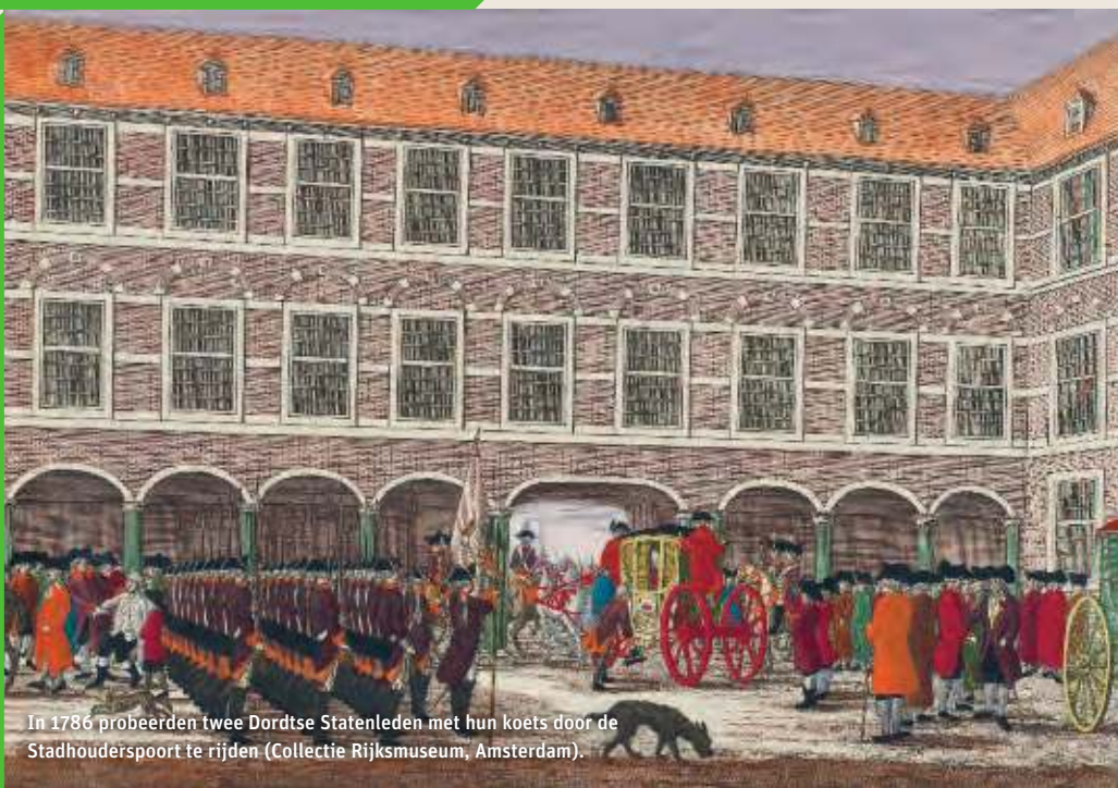
In 1786 probeerden twee Dordtse Statenleden met hun koets door de Stadhouderspoort te rijden.