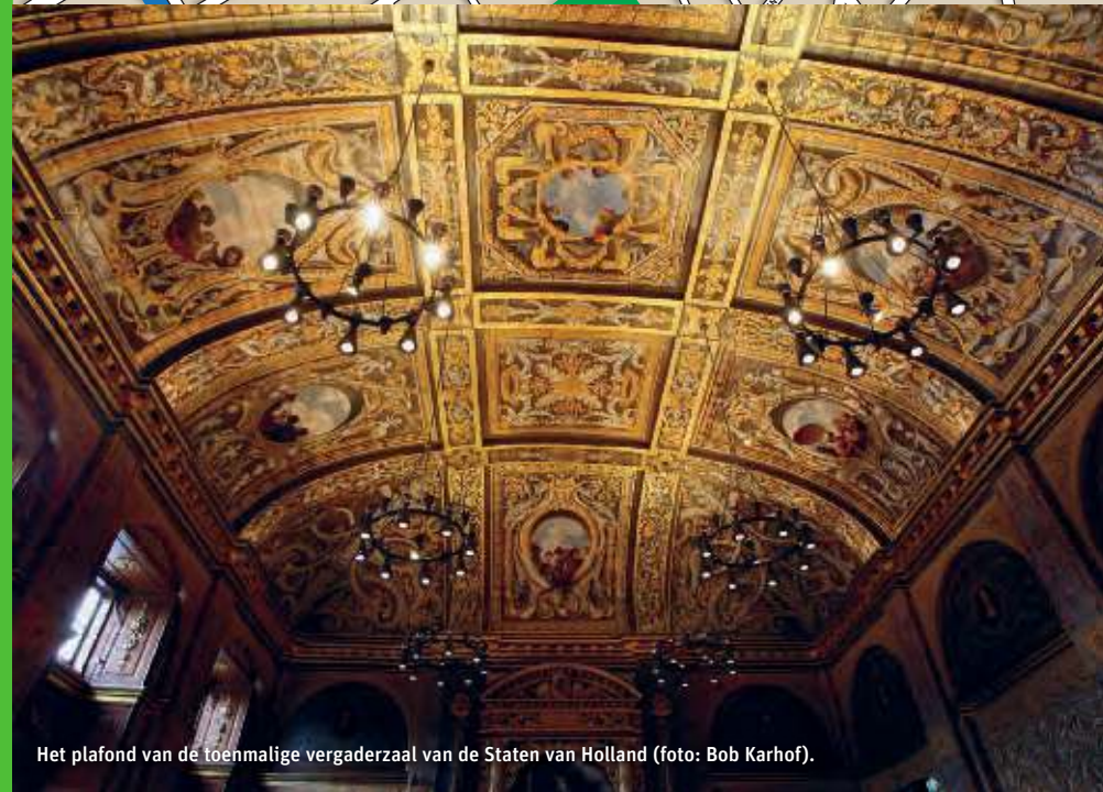
Het plafond van de toenmalige vergaderzaal van de Staten van Holland.